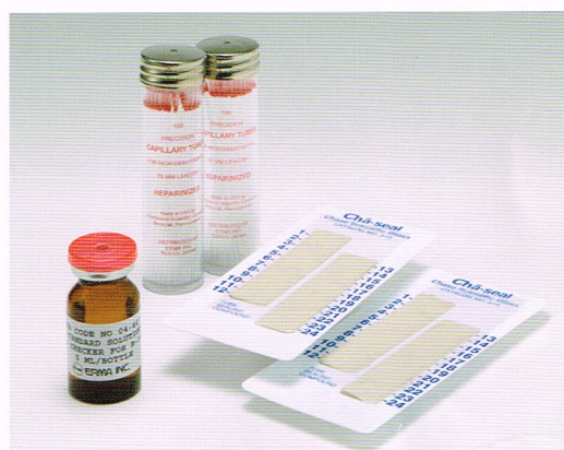
左から、代用標準液、毛細管、タップシール From left to right, ST checker, Capillary tube, and Tap Seal