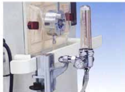
Nアイデアル 保育器用流量計

最も殺菌力のつよい253.7nmの波長が多く出ます。 AC100V、50Hzまたは60Hz専用 (ご指定下さい)