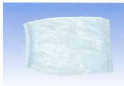
処置窓用ビニール袖