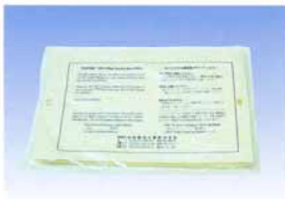
保育器用マイクロフィルタ