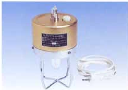
Nアイデアル 紫外線殺菌灯

最も殺菌力のつよい253.7nmの波長が多く出ます。 AC100V、50Hzまたは60Hz専用 (ご指定下さい)