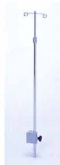
Nアイデアル 保育器用 IVボール

保育器のキャ ビネット架台 に取り付け用 の穴があいて いるのですぐ 付けられます。