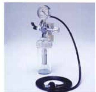
Nアイデアル 保育器用吸引瓶セット